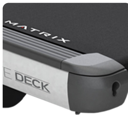
Кованые алюминиевые наконечники боковых направляющих - это не только элемент дизайна, но и великолепная защита от царапин