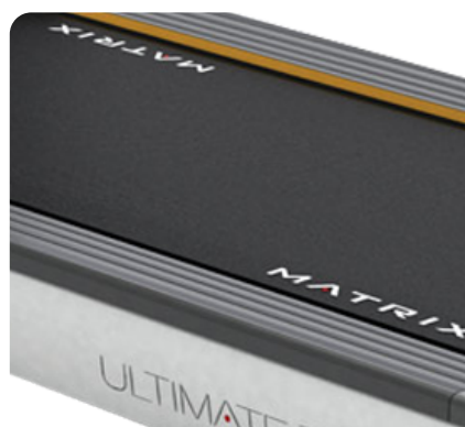
Амортизационная система настроена на оптимальную жесткость, на любых скоростных режимах дорожка максимально комфортна и безопасна