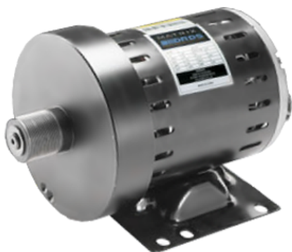
Двигатель собственной разработки с адаптивной выходной мощностью обеспечивает абсолютно равномерное движение полотна для пользователей любого веса на всем скоростном диапазоне