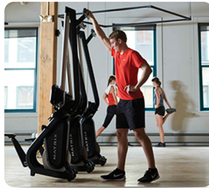
Оптимизируйте пространство в клубе, если тренажер не используется