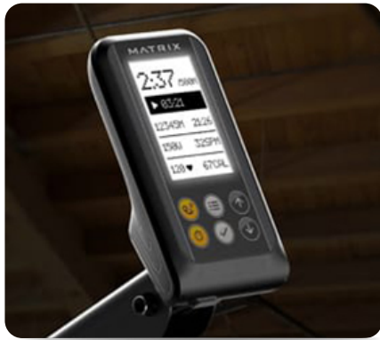
Новейшая регулируемая консоль с подсветкой предусматривает наличие встроенных программ, отображения основных показателей тренировки, а также использования нагрудного датчика