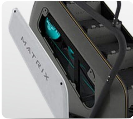
Съемные блоки и ряд других инноваций для быстрого сервисного обслуживания