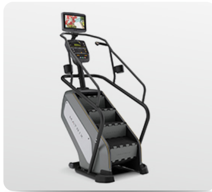
Возможность использования дополнительного ТВ-экрана