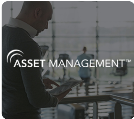
"Облачный" сервис дистанционного мониторинга и управления оборудованием