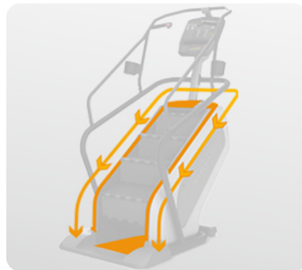
Система защиты от пота для лучшей защиты узлов и деталей от коррозии