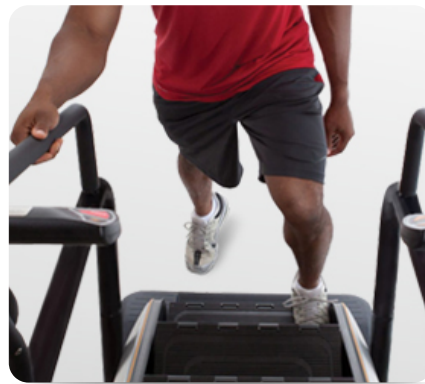
Механизм блокировки движения ступеней во время подготовки к тренировке, паузы или в случае попадания инородных предметов