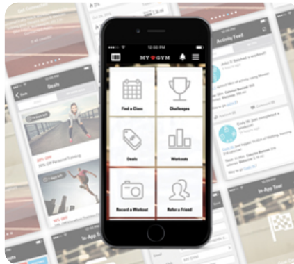
Workout Tracking Network - сервис для сохранения и анализа результатов тренировок пользователей (опционально)

Архангельск (8182)63-90-72 Астана (7172)727-132 Астрахань (8512)99-46-04 Барнаул (3852)73-04-60 Белгород (4722)40-23-64 Брянск (4832)59-03-52 Владивосток (423)249-28-31 Волгоград (844)278-03-48 Вологда (8172)26-41-59 Воронеж (473)204-51-73 Екатеринбург (343)384-55-89 Иваново (4932)77-34-06