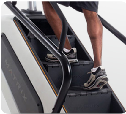
Общая площадь рабочей зоны подходит для пользователя любого роста, высота ступени 203 мм. и глубина 254 мм. является наиболее удобной