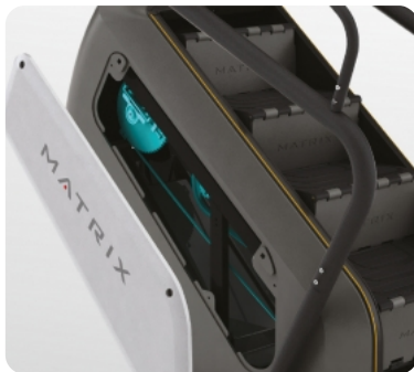
Съемные боковые кожухи и ряд других инноваций для быстрого сервисного обслуживания