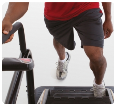
Остановка ступеней в нижней точке для удобного захода на тренажер

Архангельск (8182)63-90-72 Астана (7172)727-132 Астрахань (8512)99-46-04 Барнаул (3852)73-04-60 Белгород (4722)40-23-64 Брянск (4832)59-03-52 Владивосток (423)249-28-31 Волгоград (844)278-03-48 Вологда (8172)26-41-59 Воронеж (473)204-51-73 Екатеринбург (343)384-55-89 Иваново (4932)77-34-06