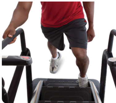
Механизм блокировки движения ступеней во время подготовки к тренировке, паузы или в случае попадания инородных предметов