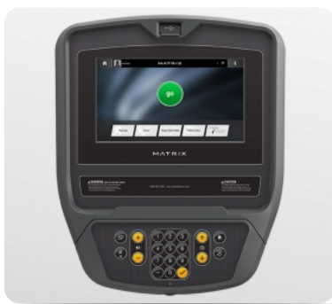
10-ти дюймовый сенсорный TFT-LCD дисплей Vista Clear™ на ОС Android с Wi-Fi доступом к различным интернет приложениям