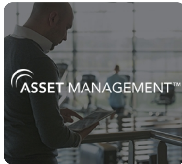
Доступ в кабинет управления Asset Management™ с консоли либо мобильного устройства