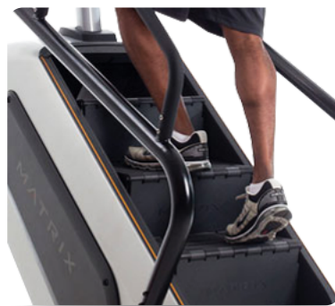
Общая площадь рабочей зоны подходит для пользователя любого роста, высота ступени 203 мм. и глубина 254 мм. является наиболее удобной