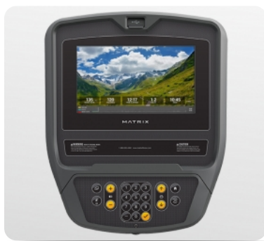
Virtual Active (Виртуальный Ландшафт) - программа, которая перенесет тренировку в самые живописные места планеты. Доступна опционально.