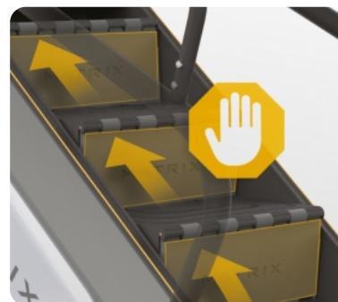
Моментальная остановка механизма в случае попадания любого предмета между ступеней