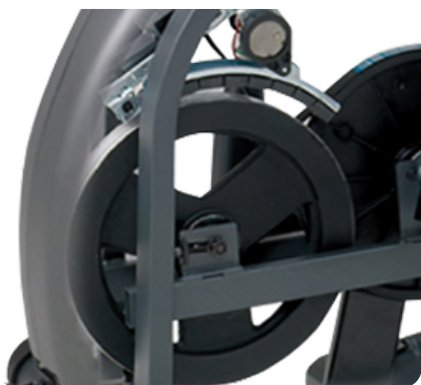
Бесшумная трансмиссия QuietGlide™ с бесконтактным JID™ генератором для самого плавного хода и равномерной нагрузки