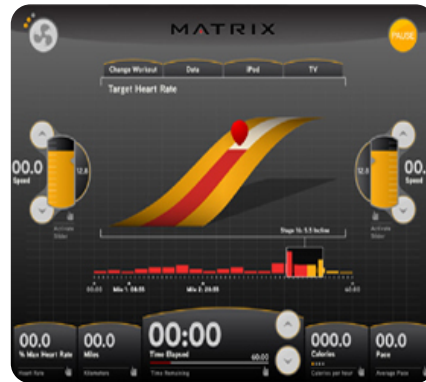
Элемент пользовательского программного интерфейса