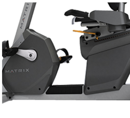
Легкий доступ к тренажеру

Архангельск (8182)63-90-72 Астана (7172)727-132 Астрахань (8512)99-46-04 Барнаул (3852)73-04-60 Белгород (4722)40-23-64 Брянск (4832)59-03-52 Владивосток (423)249-28-31 Волгоград (844)278-03-48 Вологда (8172)26-41-59 Воронеж (473)204-51-73 Екатеринбург (343)384-55-89 Иваново (4932)77-34-06