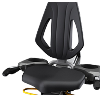
Вентилируемое сиденье ErgoForm™ с горизонтальной регулировкой и выверенной эргономикой обеспечивает комфортную тренировку