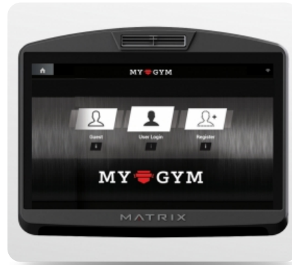
Брендование интерфейса под свой клуб