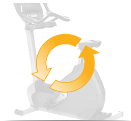
Независимость от электросетей для экономии электроэнергии и оптимального расположения