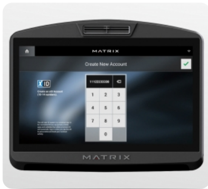
xID - личная учетная запись для мониторинга статистики тренировок