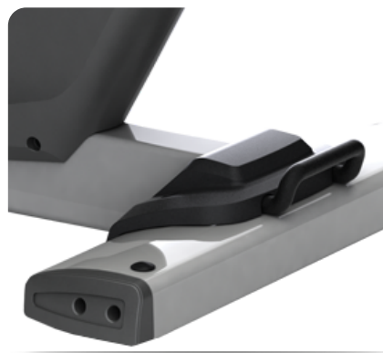
Простая транспортировка внутри помещения

Архангельск (8182)63-90-72 Астана (7172)727-132 Астрахань (8512)99-46-04 Барнаул (3852)73-04-60 Белгород (4722)40-23-64 Брянск (4832)59-03-52 Владивосток (423)249-28-31 Волгоград (844)278-03-48 Вологда (8172)26-41-59 Воронеж (473)204-51-73 Екатеринбург (343)384-55-89 Иваново (4932)77-34-06