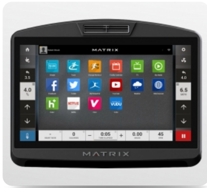
16-ти дюймовый сенсорный тач TFT-LCD дисплей Vista Clear™ на ОС Android с WI-FI доступом к различным интернет приложениям