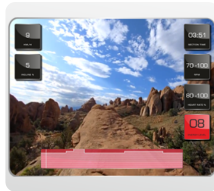
Виртуальный ландшафт™ - технология синхронизации тренажера и специально снятых видео роликов