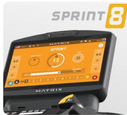
SPRINT 8 - научно-разработанная программа для высокоинтенсивных интервальных кардио тренировок (ВИИТ)