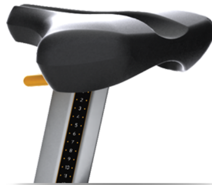
Вентилируемое сиденье ErgoForm™ с вертикальной регулировкой для максимально комфортной тренировки