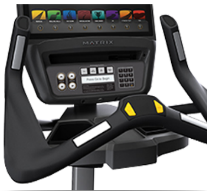
Эргономически выверенные ручки, имитирующие руль настоящего гоночного велосипеда