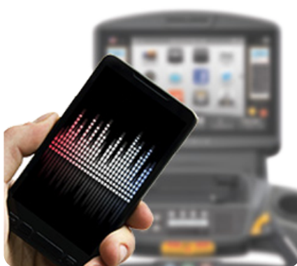
Синхронизация видео- и аудио-файлов с большинством современных планшетов и смартфонов