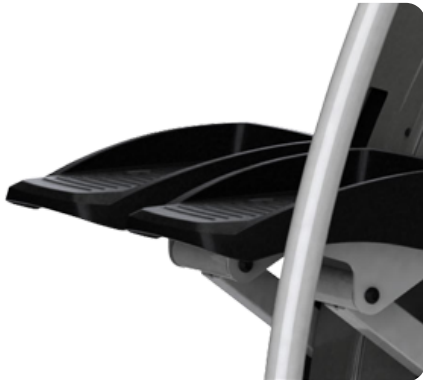
Рифленные прорезиненные нескользящие педали для самого устойчивого положения