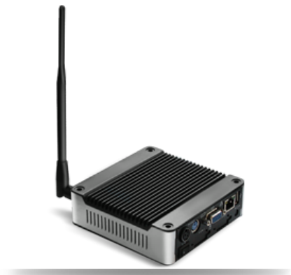
Внешний роутер Matrix Asset Management™ для сбора и анализа данных состояния оборудования в режиме on-line