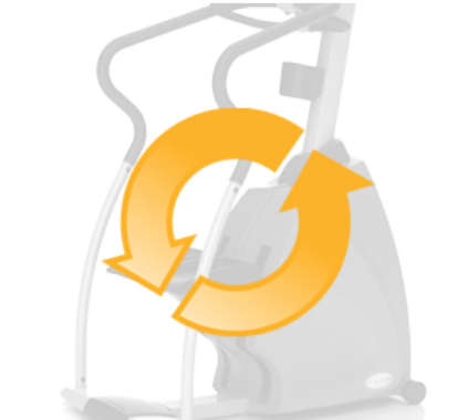
Независимость от электросетей для экономии электроэнергии и оптимального расположения