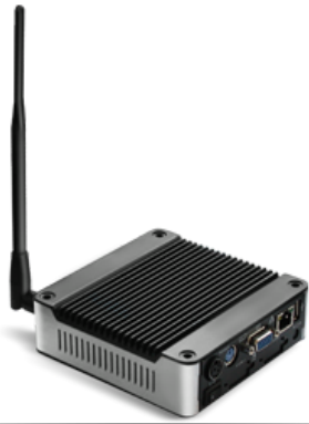
Внешний роутер Matrix Asset Management™ для сбора и анализа данных состояния оборудования в режиме on-line