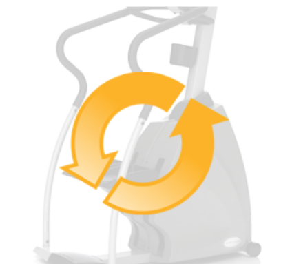
Независимость от электросетей для экономии электроэнергии и оптимального расположения