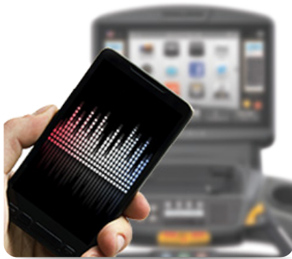
Синхронизация видео- и аудио-файлов с большинством современных планшетов и смартфонов