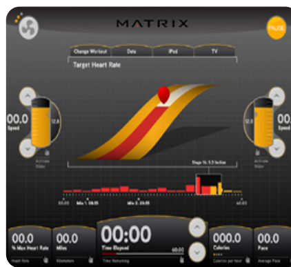
Элемент пользовательского программного интерфейса