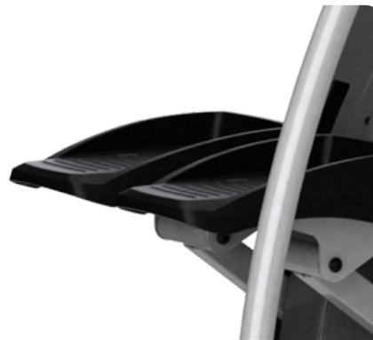
Рифленные прорезиненные нескользящие педали для самого устойчивого положения

Архангельск (8182)63-90-72 Астана (7172)727-132 Астрахань (8512)99-46-04 Барнаул (3852)73-04-60 Белгород (4722)40-23-64 Брянск (4832)59-03-52 Владивосток (423)249-28-31 Волгоград (844)278-03-48 Вологда (8172)26-41-59 Воронеж (473)204-51-73 Екатеринбург (343)384-55-89 Иваново (4932)77-34-06