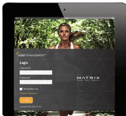
Доступ в кабинет управления Asset Management™ с консоли либо мобильного устройства