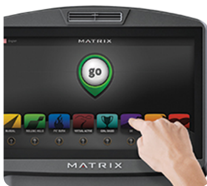
16-ти дюймовый сенсорный тач TFT-LCD дисплей Vista Clear™ для фитнес приложений и мультимедиа