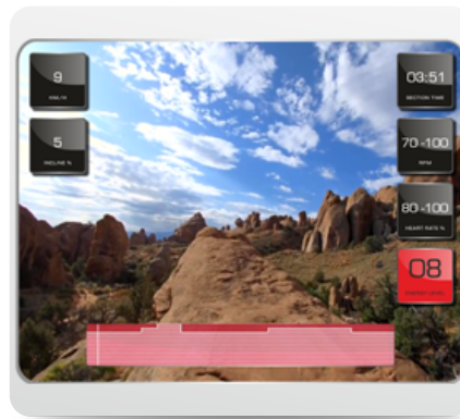
Виртуальный ландшафт™ - технология синхронизации тренажера и специально снятых видео роликов