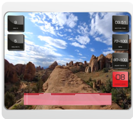
Виртуальный ландшафт™ - технология синхронизации тренажера и специально снятых видео роликов