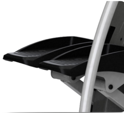
Рифленные прорезиненные нескользящие педали для самого устойчивого положения