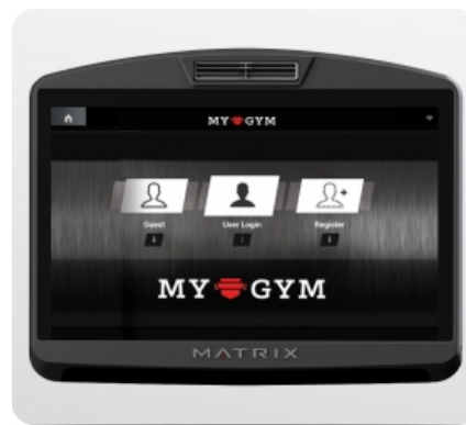
Брендиование интерфейса под свой клуб