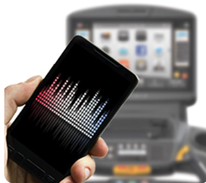
Синхронизация видео- и аудио-файлов с большинством современных планшетов и смартфонов