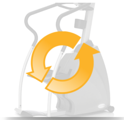
Независимость от электросетей для экономии электроэнергии и оптимального расположения

Архангельск (8182)63-90-72 Астана (7172)727-132 Астрахань (8512)99-46-04 Барнаул (3852)73-04-60 Белгород (4722)40-23-64 Брянск (4832)59-03-52 Владивосток (423)249-28-31 Волгоград (844)278-03-48 Вологда (8172)26-41-59 Воронеж (473)204-51-73 Екатеринбург (343)384-55-89 Иваново (4932)77-34-06