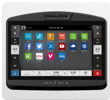
16-ти дюймовый сенсорный тач TFT-LCD дисплей Vista Clear™ на ОС Android с WI-FI доступом к различным интернет приложениям