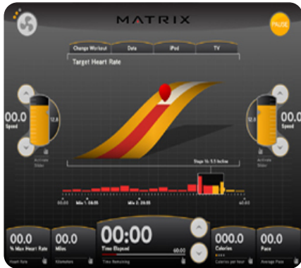
Элемент пользовательского программного интерфейса