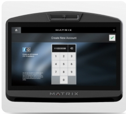
xID - личная учетная запись для мониторинга статистики тренировок